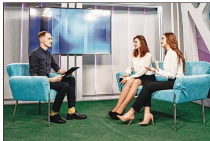
Interessierte können die große Talk-Runde vor Ort oder auch im Livestream verfolgen.

Schwentinental Am Freitag und Samstag, 17. und 18. März, lädt Caravanpark Spann...an in seiner Zweigstelle Krüger-Caravan by Spann...an in der Gutenbergstraße 11 in 24223 Schwentinental zum Frühlingsfest ein. Die Besucher haben Gelegenheit vor Ort